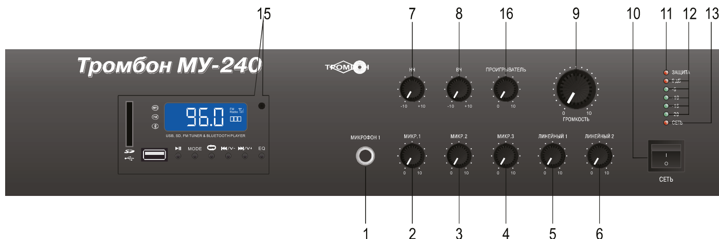
Рис. 1. Вид на переднюю панель усилителя Тромбон МУ-240