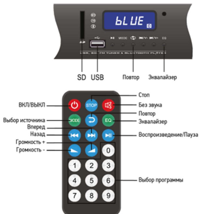
Рис. 3. Внешний вид пульта управления и модуля проигрывателя, расположенного на передней панели Тромбон МУ-XXX

Кнопки управления на проигрывателе имеют те же названия, что и на пульте дистанционного управления. Назначение