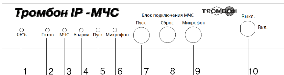
Рисунок 1 - Вид спереди